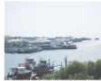
Jeti Kuala Kedah