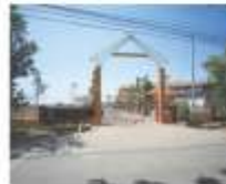
Sekolah Menengah Kubang Rotan