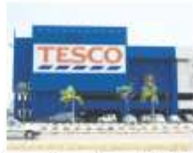
Pasar Raya Besar "TESCO"