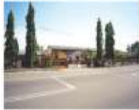
Sekolah Rendah Dato Shaari