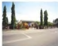
Sekolah Rendah Dato Shaari