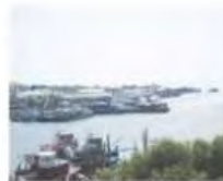
Jeti Kuala Kedah