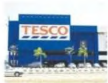
Pasar Raya Besar "TESCO"