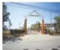
Sekolah Menengah Kubang Rotan